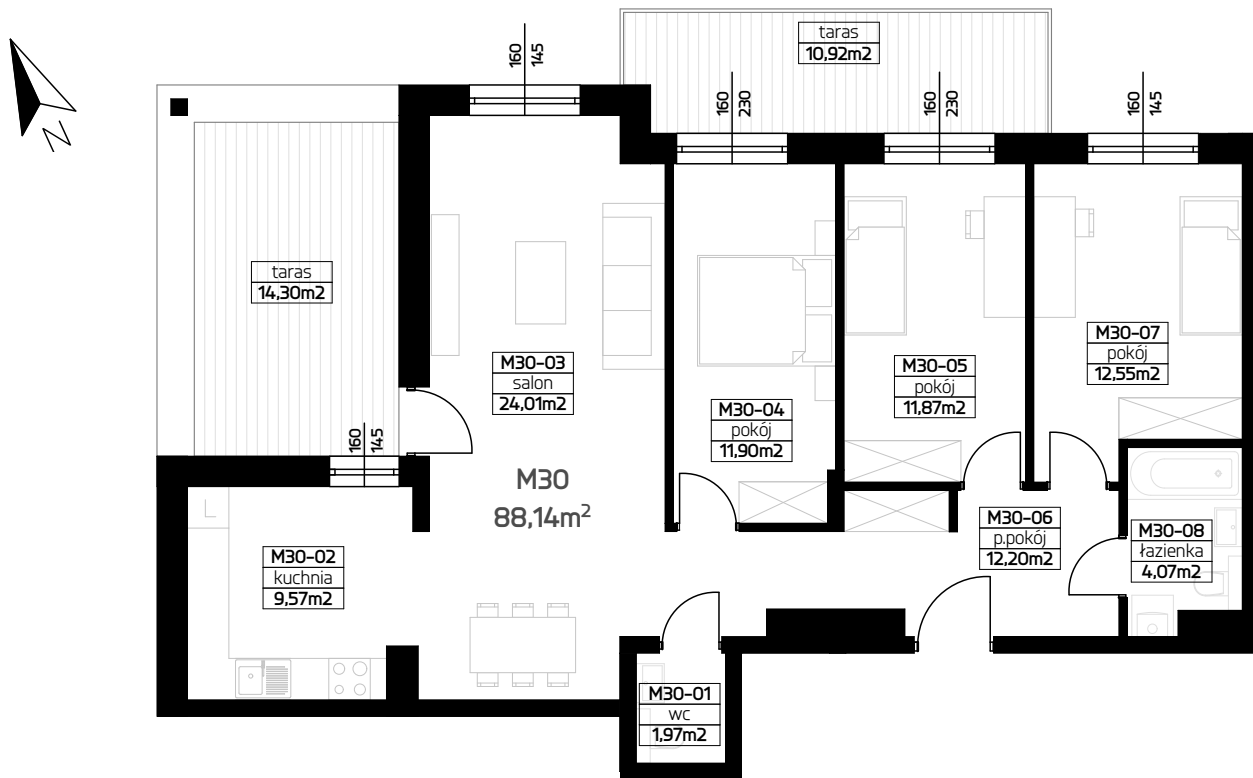
RZUT MIESZKANIA 1:100